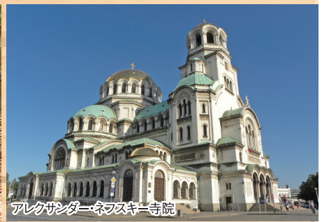
アレクサンダー・ネフスキー寺院