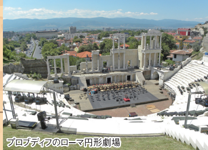
プロブディフのローマ円形劇場