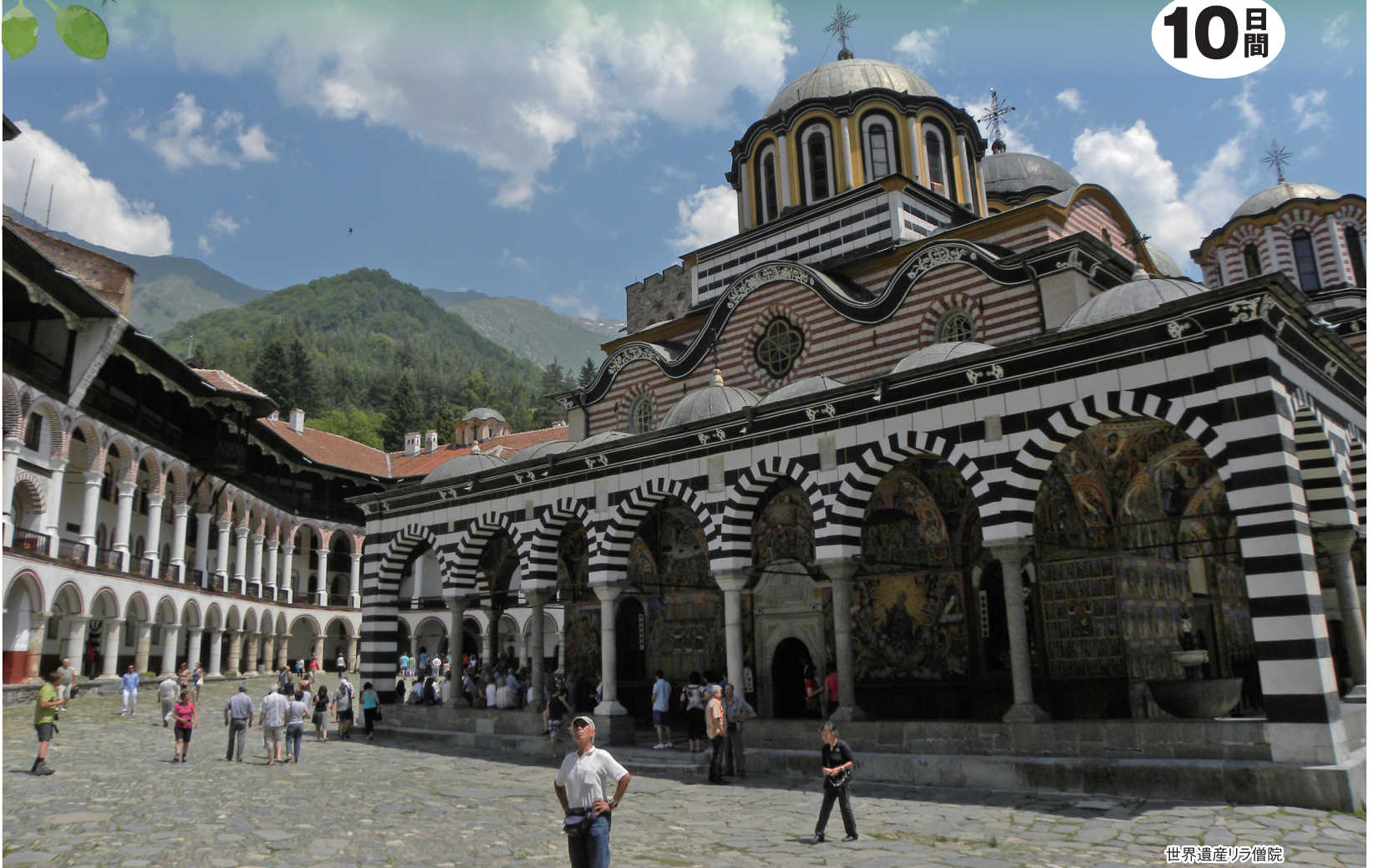
世界遺産リラ僧院