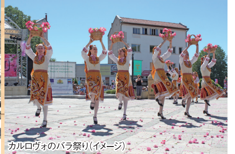
カルロヴォのバラ祭り(イメージ)