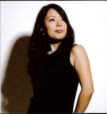
Emiko Uchiyama (日本) 内山 詠美子

アダムス社トップアーティスト。世界数々の音楽祭に招待され、ソリストとしてオーケストラと共演。ペーター・サドロ、ギドン・クレーマー、安倍圭子、神谷百子などの著名な音楽家との共演でも注目を集めている。現在オーストリアのアントン・ブルックナー大学にて教鞭をとり、数々のアーティストを育て上げる教育者としても評価が高い。総指揮を務める国際マリimbaフェスティバルは、回を重ねるたびに文化事業として称賛を受け、この秋に行われるマリimbaコンクール・リッツも大いに期待される。