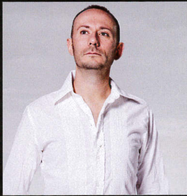
Bogdan Bacanu (オーストリア) ボクダン・バカヌ

2008年、世界的マリimba奏者、ボクダン・バカヌの呼びかけにより、ヨーロッパの各種の音楽祭に出演する内山詠美子、クリストフ・シッツェン、ヴラディ・ペトロフの4人でマリimba四重奏団を結成。音楽の聖地・発信地とも形容されるベルリン・コンチェルトハウスで華々しくデビューを飾った後、ヨーロッパ各地、アジアでの音楽祭等に次々と招待される。スペイン最古といわれるロンダ闘牛場のオープンエアコンサートでは大喝采を浴びたほか、世界的に名高いフェストシュペーレハウス(ザルツブルク)にて、モーツァルテウム管弦楽団と共演し、3夜連続で満員の聴衆からスタンディングオベーションを得る。2013年初来日ツアーでは聴衆を魅了し、高評を博す。